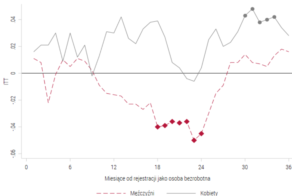
Wykres 2. Efekt programu z 2016 roku na prawdopodobieństwo bycia poza rejestrem bezrobotnych i nie w trakcie wsparcia PUP, 1 do 36 miesięcy od rejestracji, według płci

Uwagi: Znacznik na linii w konkretnym miesiącu wskazuje, że efekt jest istotny statystycznie na poziomie 5%.